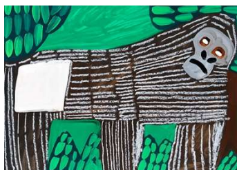
「ゴリラのさんぽ」 ひやくしまそうすけさん(14 歳)