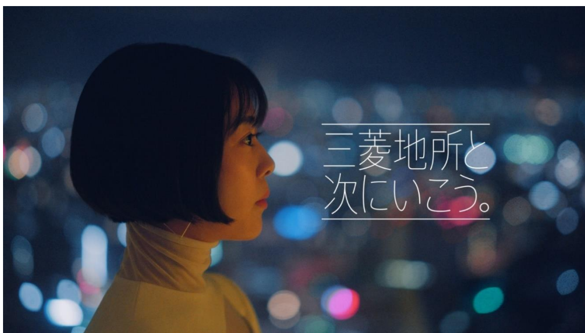
▲テレビ CM「三菱地所と次に行こう。」協創篇 30秒より

CM 映像 URL : https://youtu.be/WOnFhJZgkQs