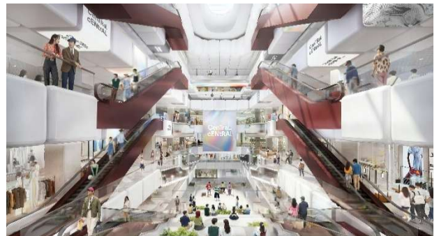
▲商業施設内装イメージ