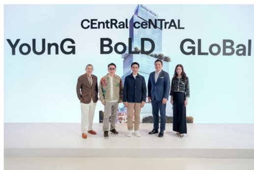
▲参画セレモニーの様子