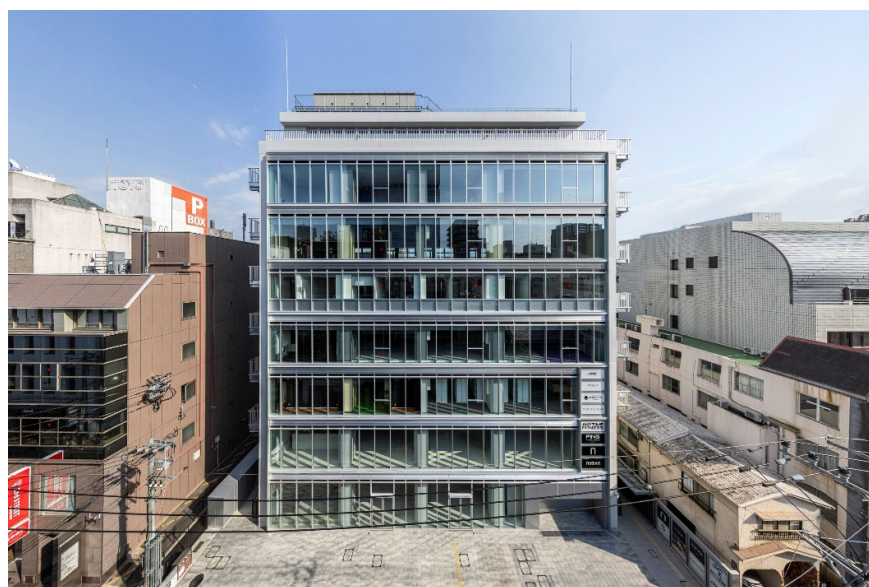
▲「エムズクロス福岡大名」外観

三菱地所は、「エムズクロス」シリーズの展開により都心エリアの交流・賑わい創出を進めるとともに、今後も福岡・天神をはじめとする九州エリアのまちづくりに貢献してまいります。