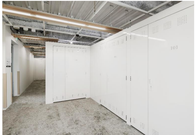
▲収納スペース内観

セルフストレージは日常生活を支える収納機能に加え、都市のレジリエンス向上に寄与するインフラとしての役割も担いつつあります。本事業を通じて、生活者の多様なニーズに応えるとともに、安心・安全な保管環境を提供することで、地域に根差した価値創出を目指してまいります。