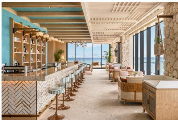
▲サンベア デイクラブ

最上階の「インフィニティプール」からは、伊良部大橋や美しいサンセットを一望でき、バー「サンベア デイクラブ」では、カラフルなドリンクや軽食とともに、宮古ブルーの海と空が溶け合う圧巻のパノラマビューを心ゆくまでご堪能ください。また、5月にオープンする「ザ・ラウンド」では、プライベートブースでバーベキューやピザパーティを家族やご友人などとお楽しみいただけます。その他、ご宿泊のお客様向けに24時間ご利用いただけるフィットネスセンターをご用意しております。