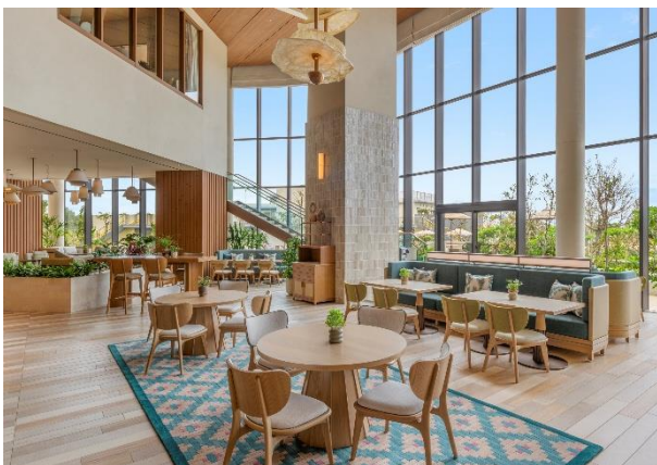
▲ザ・マーサズ・ビーチハウス

1 階のオールデイダイニング「ザ・マーサズ・ビーチハウス」は自然光が降り注ぐ開放的な空間で、宮古島の季節の味をご堪能いただけます。ホテルの 1 階に位置するディナータイム限定のグリルレストラン「CHIIKII」では、沖縄の食材をふんだんに使ったメニューをご提供します。