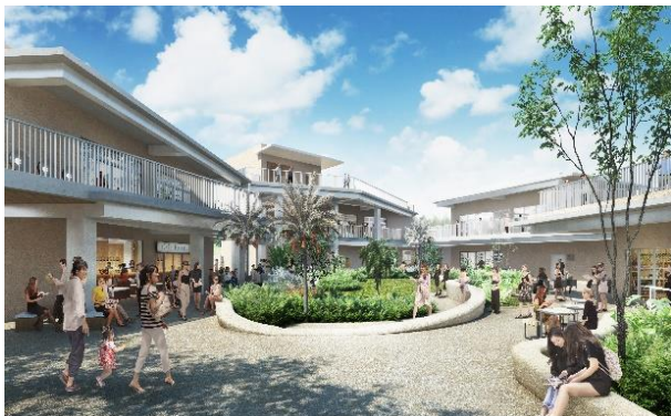
▲「Yard miyakojima」施設正面 イメージ

「Yard miyakojima」のショップ・レストラン等施設詳細は https://yardmiyakojima.com/ をご覧ください。