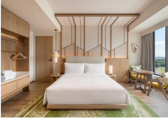
▲キングアクセシブルスイート

客室は、35 平米の「ゲストルーム」や専用バルコニー付きの「デラックスルーム」、102 平米のスイートルームまで、様々なルームタイプを兼ね備え、お客様のニーズに応える快適なご滞在をご提供します。スイートルームは 5 タイプ全 20 室をご用意。リビングとベッドルームを分けた設計で、専用バルコニーから広がる美しい海を眺めながら、宮古島ならではの心地よいお時間をお過ごしいただけます。