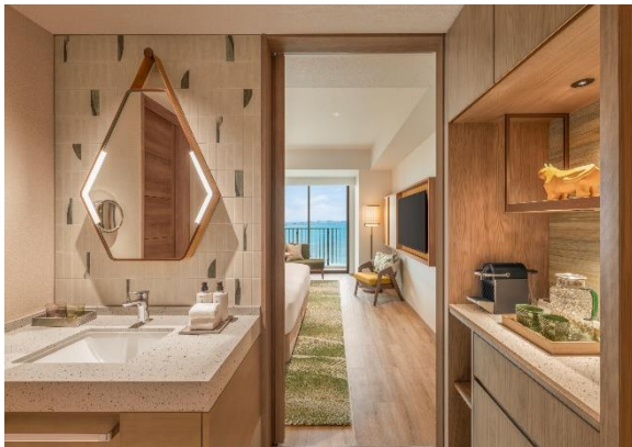
▲キングデラックスルーム オーシャンビュー