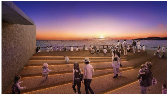
▲「Yard miyakojima」屋上サンセットテラス イメージ