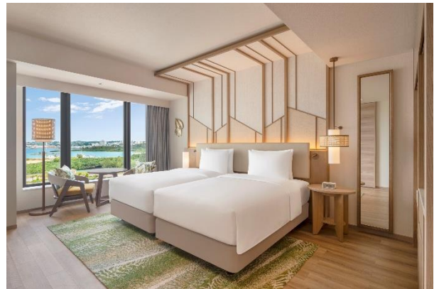
▲キングゲストルーム シティビュー

1 階のオールデイダイニング「ザ・マーサズ・ビーチハウス」は自然光が降り注ぐ開放的な空間で、宮古島の季節の味をご堪能いただけます。ホテルの 1 階に位置するディナータイム限定のグリルレストラン「CHIIKII」では、沖縄の食材をふんだんに使ったメニューをご提供します。