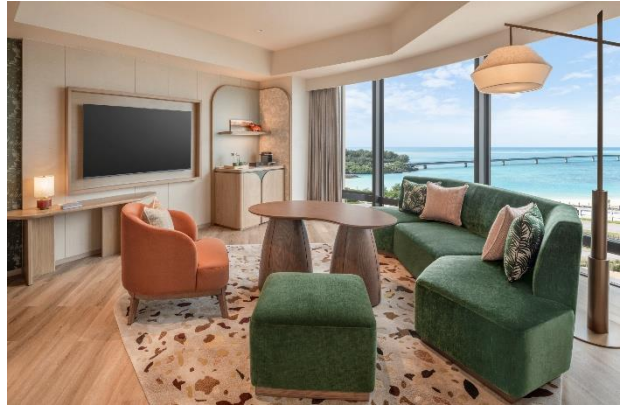
▲キングデラックススイート