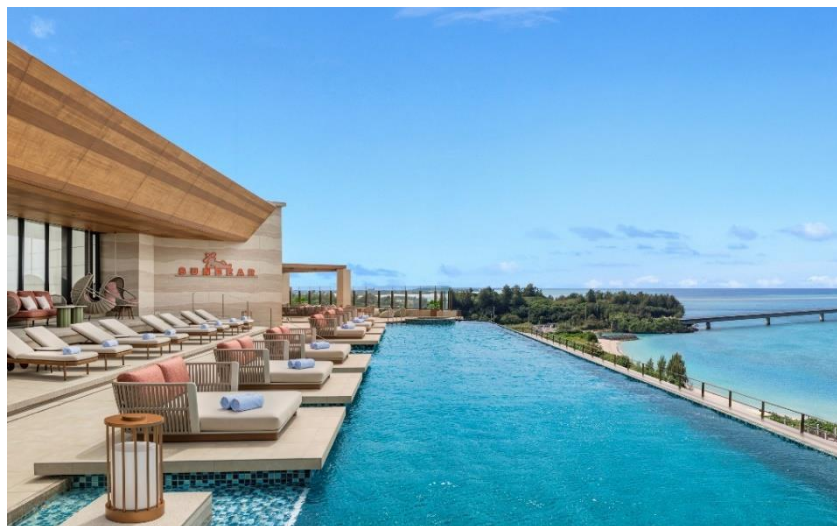
▲ルーフトップのインフィニティプール

また、三菱地所と鹿島建設は、「キャノピーby ヒルトン沖縄宮古島リゾート」隣接地に、商業施設「Yard miyakojima」を同時開業いたします。本ホテルにご宿泊されるお客様をはじめ、地域の方々や観光客の方々に広く利用される施設を目指します。