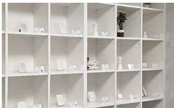
<ダイキアクシス 松山本社内・ショールーム>

*IoTとは：「モノのインターネット」という意味あり、Internet of Things の略称です。 従来、インターネットはコンピューター同士を接続するためのものでしたが、近年では住宅の中にある色々な機器もインターネット経由で接続することによって「離れた場所の状態を知る」ことが出来たり、「離れた場所の状態を変える」ことが出来るなど様々な方法で生活環境を便利に変えることが出来ます。