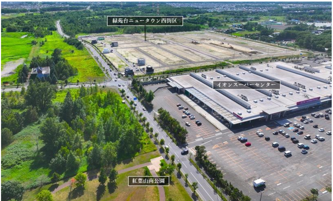
▲本プロジェクト空撮写真