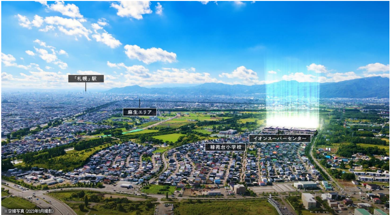
▲本プロジェクト空撮写真