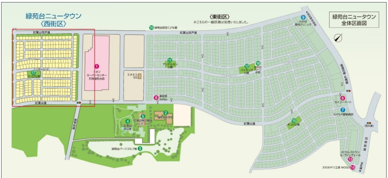
▲緑苑台ニュータウン全体区画図