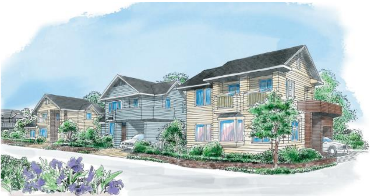
▲街並みイメージイラスト

②道路から玄関までのアプローチ部分は土のままや砂利敷きを避け、インターロッキング、石張平板、アスファルト仕上げとし、駐車場はコンクリート平板、アスファルト等で仕上げる。