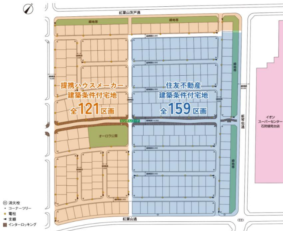
▲本プロジェクト狭域図