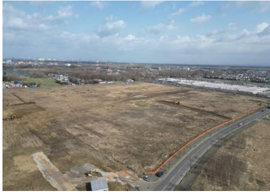
▲2023年4月 造成工事開始時