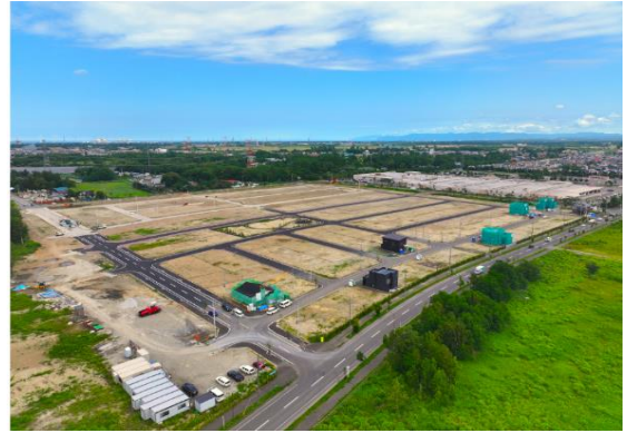
▲2024年7月 部分竣工時（154宅地分）