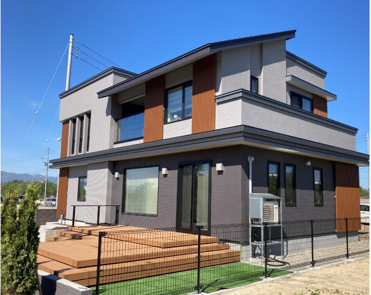
▲住友不動産のモデルハウス(本プロジェクト内に竣工)

本プロジェクト 280 区画中、159 区画は住友不動産の条件付土地の販売を予定しています。グッドデザイン賞を多数受賞するデザイン、ハイグレードな住宅設備、高級感あふれる室内装とともに、地震に強い技術を備えた高品質かつ高性能な注文住宅です。