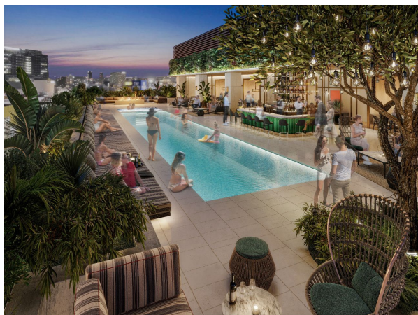
▲ルーフトッププールイメージ