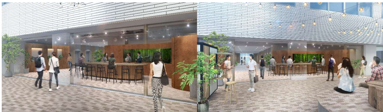
▲丸の内仲通り側との貫通区画(WICK LOUNGE) イメージ