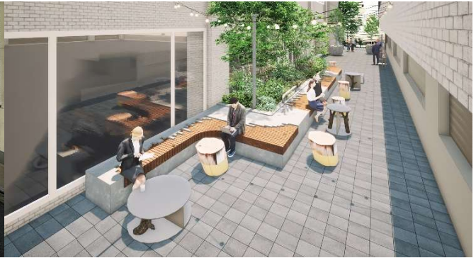
▲リニューアル後大名小路側通路 イメージ