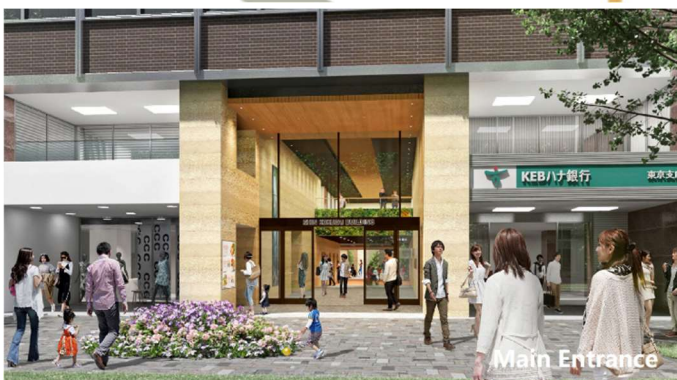
▲丸の内仲通り側新国際ビルメインエントランス イメージ