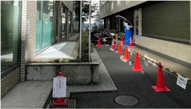
▲リニューアル前大名小路側通路