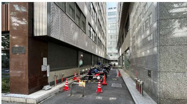
▲リニューアル前大名小路側通路入口