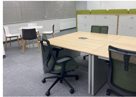
▲エコファニのリユース家具を使用したセットアップオフィスの事例