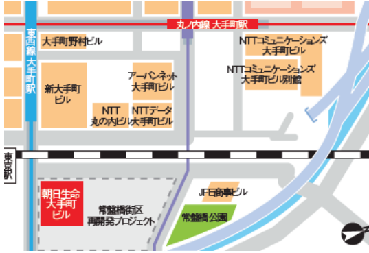
▲朝日生命大手町ビル広域図