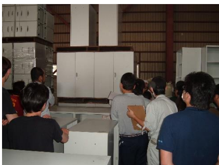
▲オークションの様子

プラス株式会社及びプラスグループの物流機能を担うプラス ロジスティクス株式会社と提携し、一定期間販売に至らないエコファニリユース家具は、プラス ロジスティクス株式会社が主催するオークションを通じて販売します。オークションで買い手のつかなかった家具は、素材別に解体・分別の上、再資源化し、リサイクル率90%以上を目標に、産業廃棄物の低減・環境負荷の軽減を目指します。