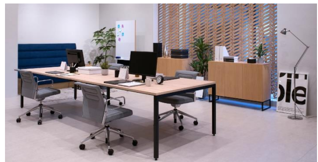
▲法人サービス「CLAS BUSINESS」のコーディネート例