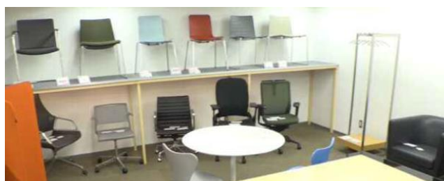
▲朝日生命大手町ビル内のエコファニショールーム・倉庫

本サービスは、三菱地所が2009年より実施している「新事業提案制度」により生まれたサービスです。同制度は、広く社員から事業提案やアイデアを募集するもので、オフィスのレイアウト変更等に伴い、まだ使えるオフィス家具の多くが、やむを得ず処分される状況を目の当たりにした社員が、フレキシブルなワークスペースとサステナブル社会を両立させるサービスとして企画・立案・事業化いたしました。