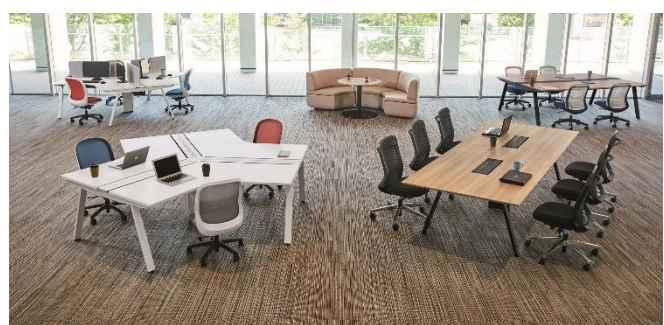
▲PLUS は家具コーディネートも実施