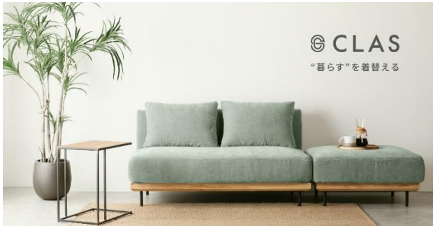
▲「暮らす」を着替える」がコンセプトの「CLAS」

株式会社クラスと提携し、エコファニのリユース家具の一部は家具・家電のサブスクリプションサービス「CLAS」(クラス)に供用します。既に高級オフィスチェアを中心に CLAS より利用可能になっており、法人へのニーズのみならず在宅勤務支援をはじめとした個人へのニーズもカバーします。