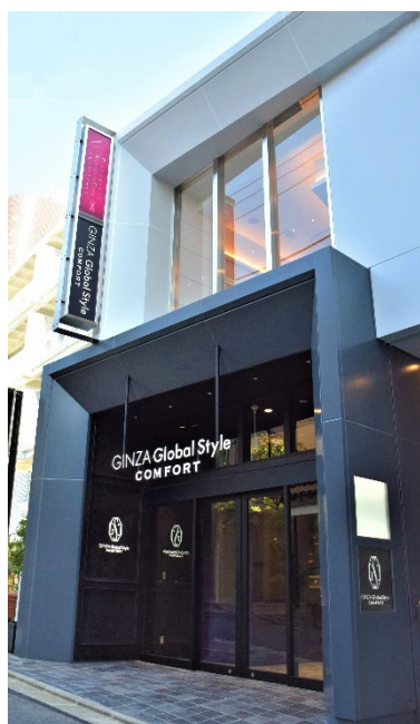
▲建物外観イメージ

併せて、当社は「エムズクロス神宮前」を通じて、今後も神宮前・表参道エリアにおける魅力向上に貢献するとともに、エムズクロスブランドのシリーズ化により、首都圏を中心に、立地特性や時代のニーズを柔軟に取り入れ、新たな交流・価値創造を提供していきます。