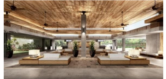
▲国内線搭乗待合室 完成予想 CG