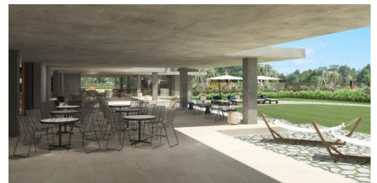
▲出発ラウンジ・テラス 完成予想 CG