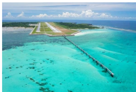
▲下地島空港 鳥瞰写真(北側より)