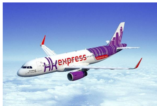
▲香港エクスプレス エアバス A320 型機

三菱地所とSAMCOは、沖縄県や宮古島市、沖縄観光コンベンションビューロー、宮古島観光協会と連携し、官民一体で本路線を含む航空路線の利用促進に取り組むほか、さらなる新規路線開設に向けた誘致活動を進め、内外交流人口拡大により、地域活性化に貢献してまいります。