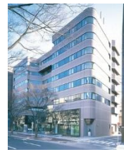
▲定禅寺パークビル