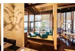
▲東京和食 文史郎 (和食酒場)