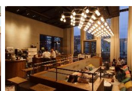
▲HENRY GOOD SEVEN (ラウンジ ダイニング)