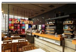
▲SO TIRED (ダイニング)