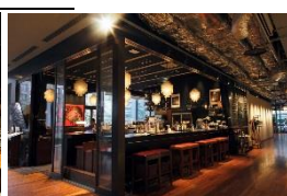
▲欧風小皿料理 沢村 (熟成酵母パンと欧風小皿料理)