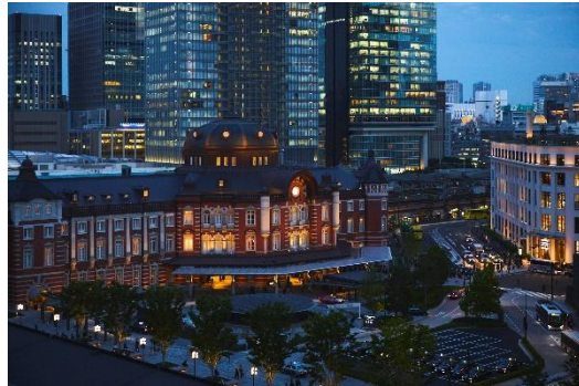
▲テラスからの東京駅丸の内駅舎の眺め