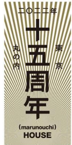
▲「丸の内ハウス」 15周年記念ロゴ

本イベントでは、オープン15年の感謝とともに、ニューノーマルにも対応したオンラインでの前売りチケット販売による非接触受付や、出演者と来場者のディスタンスの確保など新型コロナウイルス感染拡大防止に努め、来訪者に安心してお楽しみいただけるよう様々な対策を行い実施いたします。