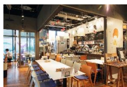
▲MUS MUS (無国籍料理)