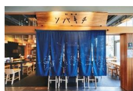
▲ソバキチ (蕎麦・酒・肴)