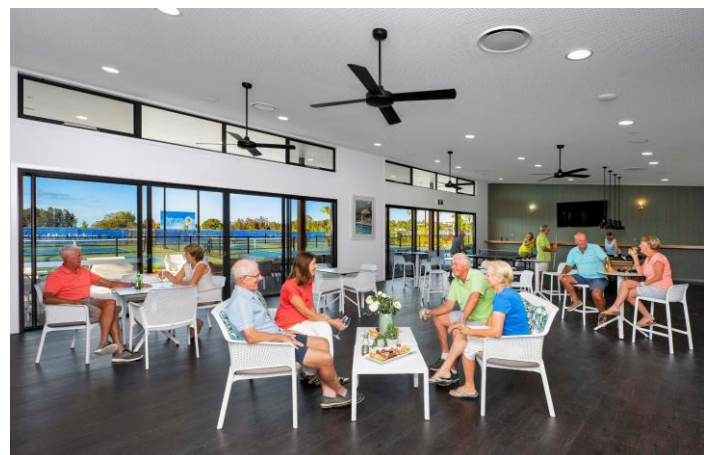
▲Land Lease Community イメージ画像