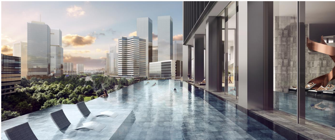
▲インフィニティプールイメージ