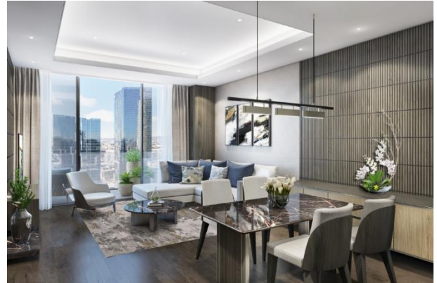
▲分譲型 SA 専有部イメージ