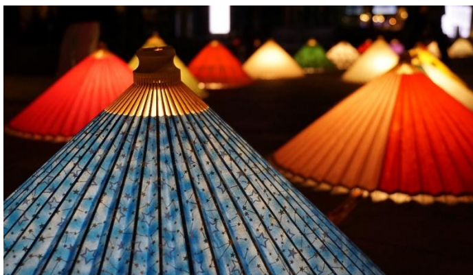
▲「和ルミネーション」による空間装飾のイメージ

「TOKYO TORCH 縁日」では、和傘とイルミネーションを合わせた「和ルミネーション」による幻想的な空間を演出。また、21日（木）は メディテーション×アート×煎茶文化を融合した没入体験型スタジオを運営する「Medicha」によるメディテーションを実施。22日（金）には、つまみ細工や型染めコースターづくりなど、日本の伝統文化に気軽に触れ合える体験イベントや浴衣レンタルサービスを展開します。