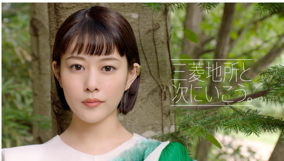
▲テレビ CM「三菱地所と次にいこう。」サステナブル篇 30秒より

CM 映像 URL : https://youtu.be/MzIDXxidYWE