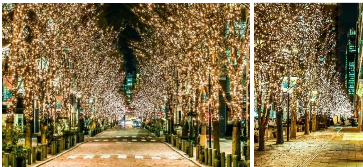
▲昨年開催時の様子

なお、新型コロナウイルス対策として、例年は 17 時～23 時（12 月は 24 時）までだったイルミネーションの点灯時間を、昨年同様に 2 時間早め、本年も 15 時から点灯します。お楽しみいただける時間を長くすることで、鑑賞いただく時間を分散させ、屋外でも密を避けながらゆったりと安心してお過ごしいただけます。