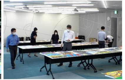
三菱地所グループ社員審査