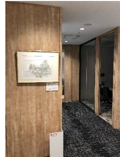
グループ会社受付

展示会に留まらず、当社本・支店およびグループ会社の会議室等の主要な空間に、コンクール優秀賞受賞作品を展示しております。