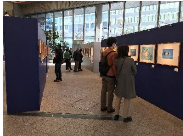
優秀賞作品展（東京会場）