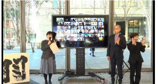
オンライン表彰式