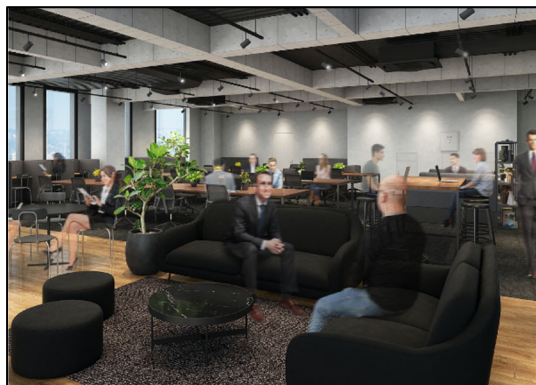
▲空間レイアウトの提案イメージ（パース）