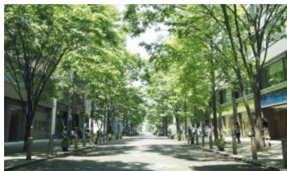
通常時の丸の内仲通りの様子