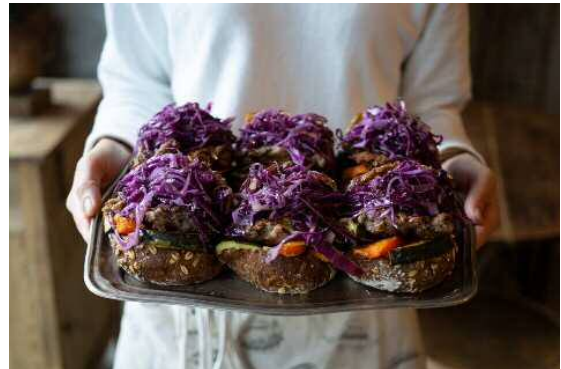
ヤフー株式会社様