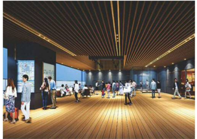
2階 歩行者デッキに面する憩いの広場（イメージ）