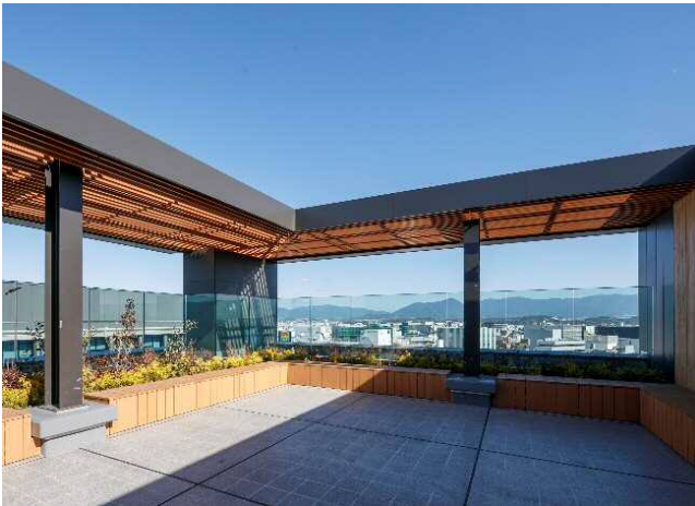
屋上 開放的なテラス空間（就業者向け）

福岡市では、「感染症対応シティ」を目指す街づくりが進められています。本計画においては、市民の方も利用できるスペースとして、博多駅から続く2階の歩行者デッキに広場を設け、開放的な憩い空間を提供します。また、就業者向けのスペースとして、屋上を緑あふれるテラスとして整備し、開放することで、3密（密閉・密集・密接）の回避を実現したリフレッシュスペースを提供します。ウィズコロナ・ポストコロナにおける利用者の満足度や生産性の向上をファシリティ面からサポートしていきます。