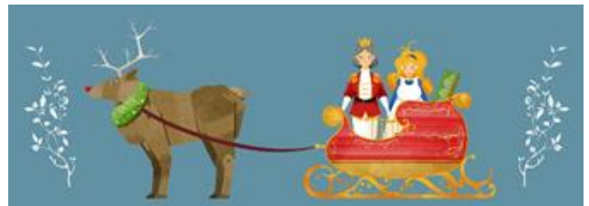
クリスマスシアター キャラクターイメージ