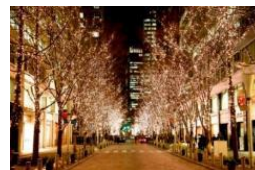
過去開催時の様子