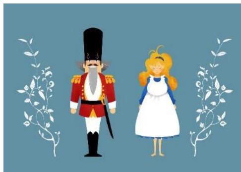
「丸ビルクリスマスシアター ～プロジェクションマッピングで贈る、くるみ割り人形の物語～」登場キャラクターイメージ