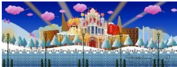
クリスマスシアター シーンイメージ