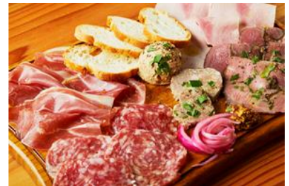
★シャルキュトリプレート (2,400 円)