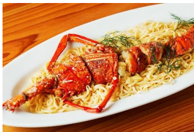
★伊勢海老入り煮込伊府麵 シャンパン仕立て (4,200 円)