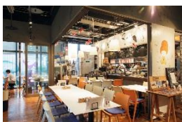
MUS MUS (無国籍料理)