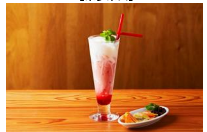
★クリスマスカクテルと ドライフルーツセット (2,000 円)