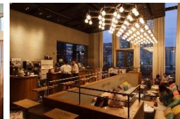
HENRY GOOD SEVEN (ラウンジ ダイニング)