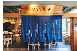
ソバキチ (蕎麦・酒・肴)