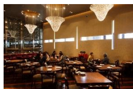
RIGOLETTO WINE AND BAR (スパニッシュイタリアン)