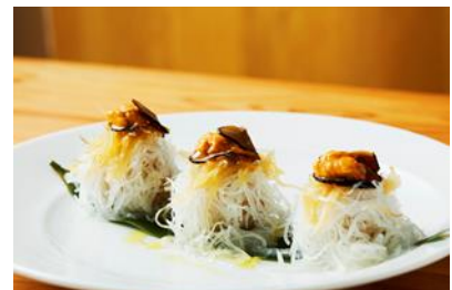
★フカヒレトリュフシューマイ (3個入り) (2,000 円)