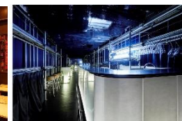
獺祭バー(marunouchi) (バー) 2020年10月1日オープン