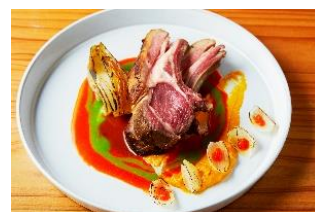
「LOVE & WISHES」メニュー例

※オリジナルマスクは先着順数量限定となります。規定数になり次第プレゼントを終了させていただきます。