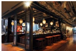
欧風小皿料理 沢村 (熟成酵母パンと欧風小皿料理)