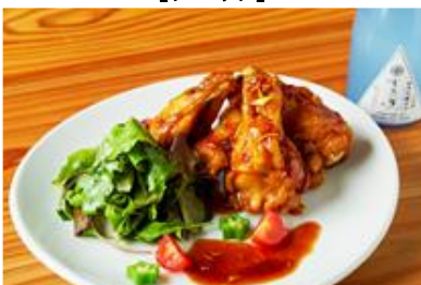
★和風ローストチキンと 水芭蕉スパークリング純米吟醸辛口(日本酒) (2,000 円)