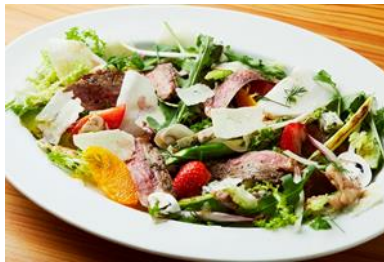
★アンガスリブロースと 冬の恵みのタリアータ (2,600 円)