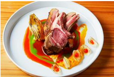
仔羊の低温ロースト アンディーブのキャラメリゼ添え (2,400 円)