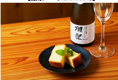
★獺祭スパークリング 45と 獺祭酒ケーキのセット (2,273 円)