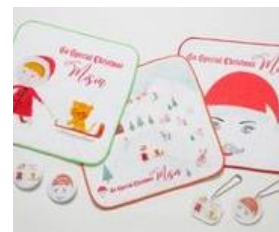
クリスマスガチャガチャで当たるグッズ例