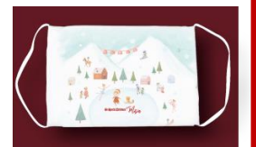
MISIA オリジナル布製マスク

※オリジナルマスクは先着順数量限定となります。規定数になり次第プレゼントを終了させていただきます。