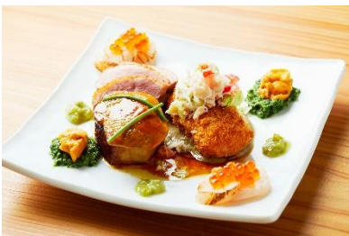
海と郷のよくばりな一皿 (3,800 円)