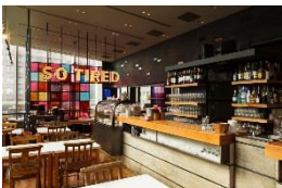
SO TIRED (ダイニング)