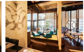
東京和食 文史郎 (和食酒場)