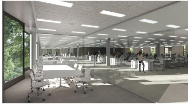
▲オフィス内装イメージ