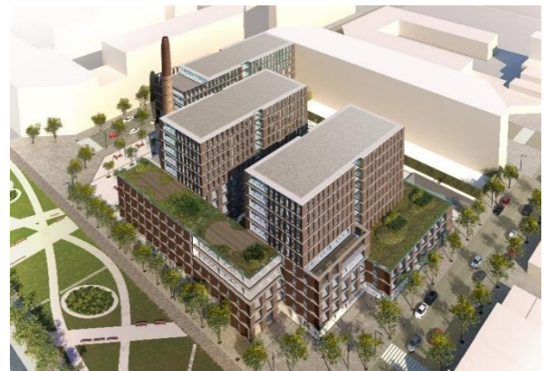
(上) 再開発街区 (全体) の竣工イメージ (右) 本事業の範囲

三菱地所グループは、長期経営計画において海外事業の拡大・進化を成長戦略の一つに掲げています。英国では1986年に現地法人を設立して以降、ロンドンにおいて計6件のオフィスビル開発*を含め累計15棟の賃貸用オフィスビルを保有・運営する等、実績を積み上げてまいりました。欧州大陸において