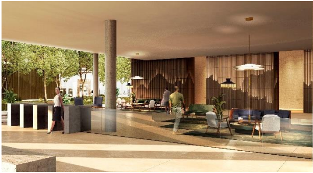
▲エントランスイメージ