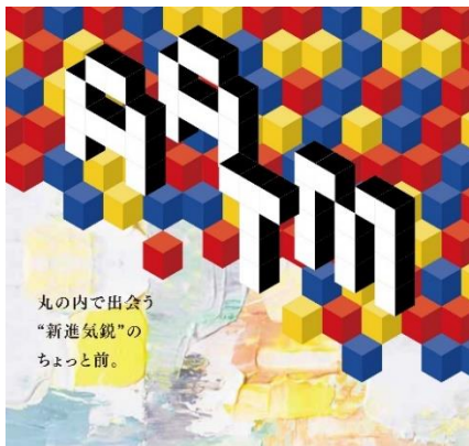
「アートアワードトーキョー丸の内 2020」 ビジュアル

（公式ウェブサイト： http://www.artawardtokyo.jp/2020/ ）