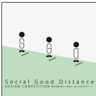
「Social Good Distance デザインコンペティション」ビジュアル

（公式ウェブサイト： https://yurakucho-micro.com/stage/stage1002/ ）