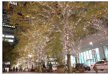
「丸の内イルミネーション」過去開催時の様子