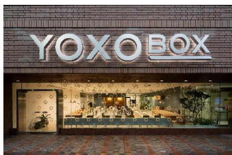
<YOXO BOX 外観>

また、2020年度は YBC・YAC の優勝チーム・上位入賞チームに対する活動拠点支援等、2019年度同様の協力支援内容を予定しており、本共同研究協定を契機として、横浜国立大学と三菱地所株式会社は、若い起業家の想いを支え、芽を紡ぎ、オープンイノベーションを更に加速していきます。