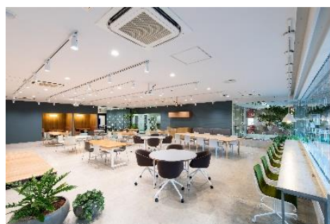
<YOXO BOX 内観>