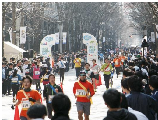
昨年開催時の様子

また、翌日の3月1日(日)に開催される「東京マラソン2020」のフィニッシュエリアが丸の内であることから、東京マラソン2020前日祭として、駅伝やステージイベント、パレードなどでフィニッシュエリアの丸の内を一層活気づけます。