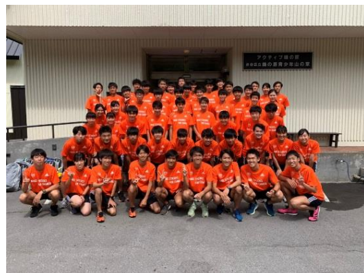
青山学院大学陸上競技部 長距離ブロックメンバー