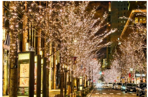
昨年開催時の様子