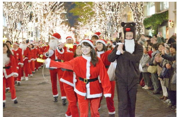
昨年開催時の様子