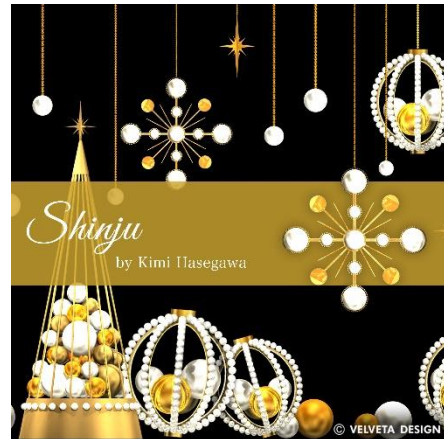
『Kimi Collection “Shinju-真珠”』

<実施期間> 2019 年 11 月 7 日(木)～12 月 25 日(水) ※ライティングショー: 17:00～24:00