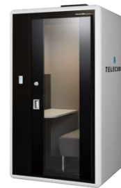
▲テレキューブ by OKAMURA