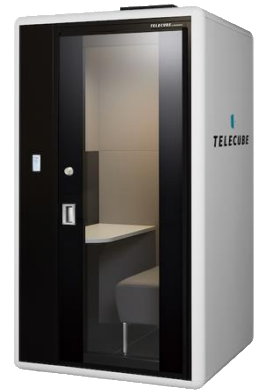
▲テレキューブ by OKAMURA

三菱地所とブイキューブは2018年11月20日（火）～2019年7月31日（水）の間、東京・丸の内エリアにおけるオフィスビル3物件の共用部への「テレキューブ」設置を皮切りに、順次エリアを拡大し計9物件22台を設置し、多くのワーカーにご利用いただくことを通じて、本製品を活用した働き方改革推進のための実証実験を行いました。その結果、①個人・法人双方での一定の申込・利用実績による、「テレキューブ」という新しいテレワークの在り方に対する潜在的ニーズの存在の確認、及び②新会社のオペレーションの検証と課題の抽出を達成しました。実験開始当初より「テレキューブ」設置および課金モデルによる事業化を視野に入れておりましたが、今後は、より広範囲への設置拡大を通じた利便性向上を達成すべく、今般の新会社設立に至りました。