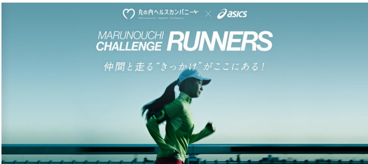
▲「丸の内ヘルスカンパニー」×「MARUNOUCHI CHALLENGE RUNNERS」キービジュアル

当社は今後も、多様な企業・人が集まる大手町・丸の内・有楽町地区（以下、丸の内エリア）の企業の枠を越えたWell-Being*（＝健康・幸福）を発信するとともに、今後も健康に関する様々な取り組みを展開し、約28万人が働く丸の内エリアから、全国へとそのムーブメントを広げていくことを目指します。