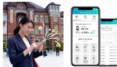
▲「丸の内ヘルスカンパニー」ロゴ・アプリイメージ