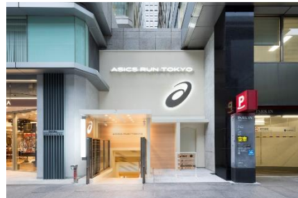
▲「ASICS RUN TOKYO MARUNOUCHI」店舗

https://www.asics.com/jp/ja-jp/mk/asicsruntokyo-marunouchi