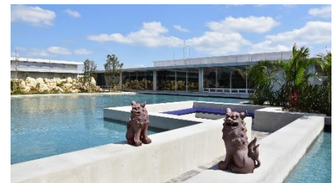
▲空港ターミナル内 水上ラウンジ