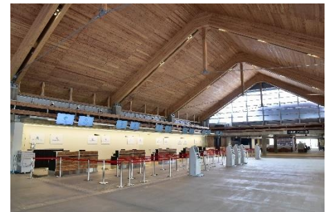
▲チェックインロビー

国際線を受け入れる専用施設を設け、スムーズな入国・出国動線を確保する等、利用者の動線を意識した設計となっており、使い勝手の良さを追求しています。