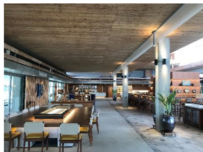
▲空港ターミナル内 待合スペース

「この度、弊社が下地島空港への初の国際チャーター便を運航できることとなり、大変光栄に存じます。この便をご利用いただき、国内外の方々々に美しい島々の魅力を是非知って頂きたいと思っております。」