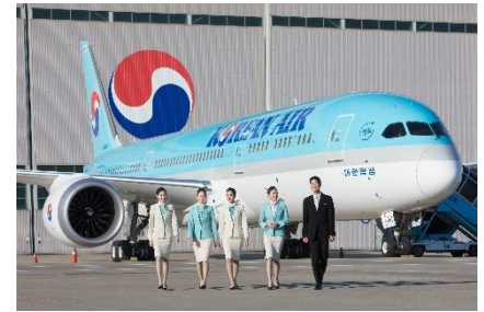
▲大韓航空 企業イメージ写真

※大韓航空のスケジュール、サービスなどは「 koreanair.com 」、「 facebook.com/KoreanAir 」をご覧ください。