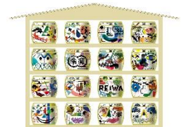
酒樽 New Age Art (イメージ)

※新元号を祝し、5月4日(土)11:00と12:00には、丸ビル／丸の内オアゾ前にて、振る舞い酒を実施。各会場先着300名様には新元号が刻印された“令和枰”をプレゼント。