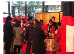
振る舞い酒の様子(イメージ)