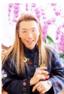
華道家 假屋崎省吾氏

丸の内エリアでは、今後もさまざまな文化芸術のイベント・情報発信を展開し、街のさらなる活性化を進めてまいります。アートや音楽で賑わう丸の内エリアのGWにぜひ足をお運びください。