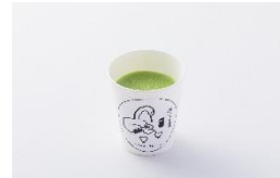
一保堂茶舗 テイクアウトの抹茶