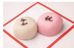
KITAYA六人衆特製 紅白まんじゅう