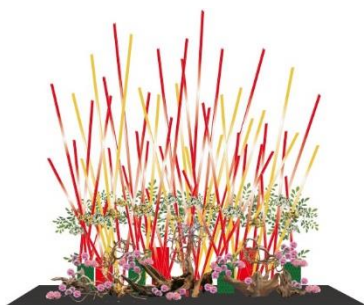
假屋崎省吾氏が制作する いけばなインスタレーション(イメージ)