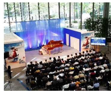
「ラ・フォル・ジュルネ TOKYO 丸の内エリアコンサート」 過去開催時の様子