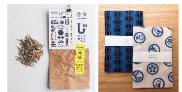
期間限定ポップアップショップ 一部商品

◇日 時：4月25日(木)～5月6日(月・振休) 11:30～19:00 ※3日(金・祝)のみ12:30～19:00 ◇場 所：丸ビル1階 マルキューブ