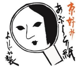
よーじや あぶらとり紙(イメージ)

■内容：改元の想いを込めて選曲した「オペラ『万葉集』より抜粋(千住明 作曲、黛まどか台本)」をお送りするスペシャルコンサートを開催。