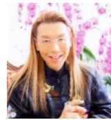
華道家 假屋崎省吾氏

◇日 時：4月25日(木)12:00～13:00 ◇場 所：丸ビル1階 マルキューブ