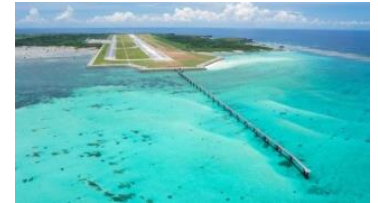
▲滑走路北側から見た下地島空港の様子