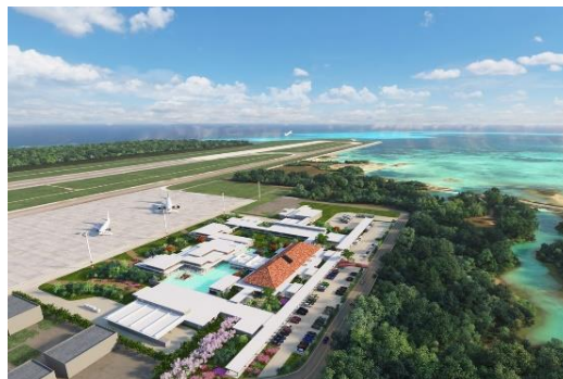
▲ターミナル完成イメージ