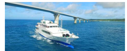
▲海中展望客船 モンブラン号