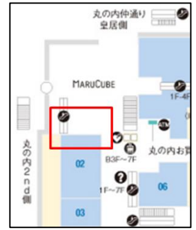
▲丸ビル内会場案内図（赤枠内）

協力：ジェットスター・ジャパン株式会社、一般財団法人沖縄観光コンベンションビューロー、一般社団法人宮古島観光協会、有限会社青空市場、株式会社沖縄県物産公社、オリオンビール株式会社、株式会社はやて、株式会社ユニマットプレシャス、株式会社宮古島東急ホテル&リゾート、株式会社オーシャンリンクス、沖縄 UDS 株式会社