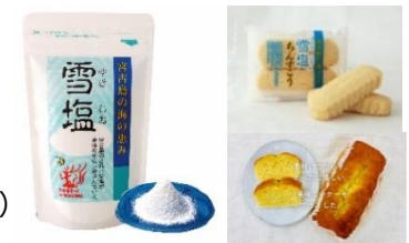
▲サンプリング品（イメージ）

◇11月15日（木）～11月18日（日） 各日12:00～13:00 ※なくなり次第終了