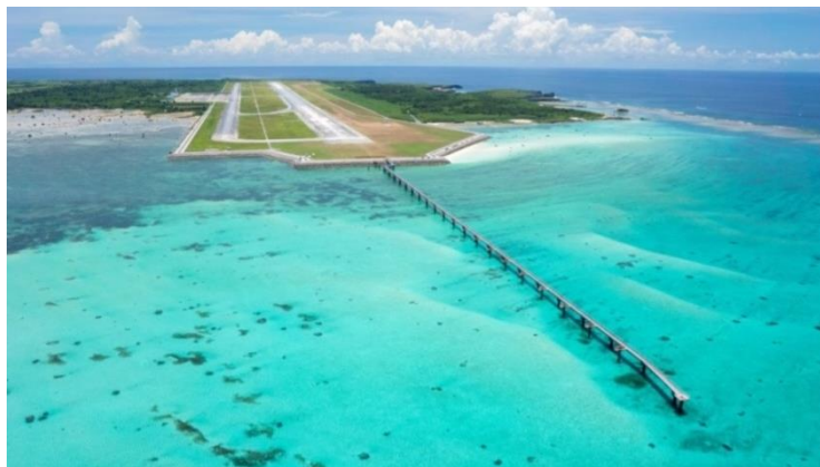
▲滑走路北側から見た下地島空港の様子

美しい自然・文化にあふれる宮古諸島への首都圏からの新たな路線の誕生を記念して、沖縄&宮古島名産品マルシェ、沖縄県名産品のサンプリング配布等、「宮古島に行きたい！」とつい感じてしまうようなコンテンツを用意します。