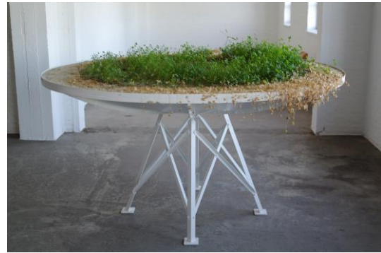
国府理 「the Garden(屋根裏の庭)」