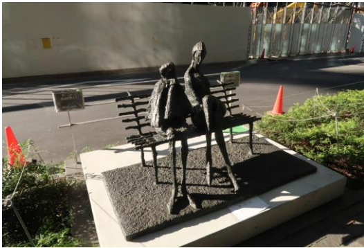
淀井敏夫 「ローマの公園」