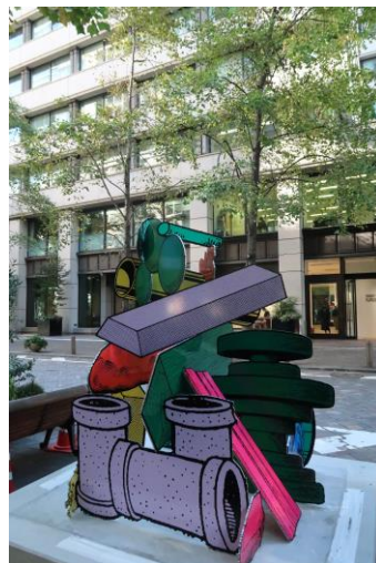
「Hard Boiled daydream(Sculpture/spook)#1」