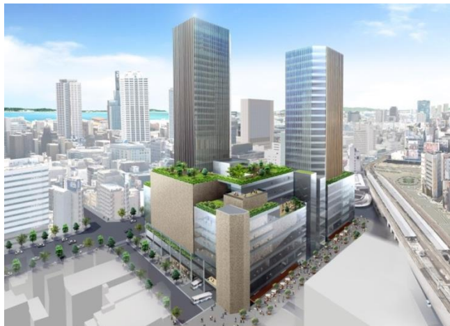
周辺エリアを含めた将来的なイメージ（北東から）

今後、再開発会社との間で基本協定を締結し、再開発会社の運営支援や都市計画提案など市街地再開発事業としての事業化の推進をサポートしてまいります。