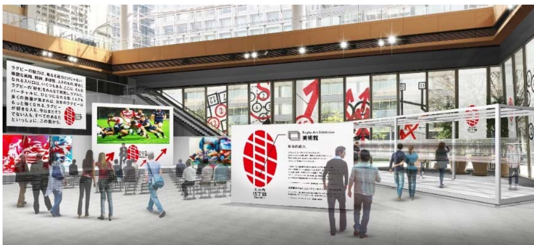
「RUGBY ART EXHIBITION」イメージ

会場では、「ジャイアントキリング」と称され歴史的な大金星となった「ラグビーワールドカップ2015」の日本対南アフリカのラスト4分間の攻防にフォーカスし、選手たちの走行データやパスの軌跡、選手の密度などを科学的に分析して、1秒単位で連続的に可視化し合計240枚のポスターで表現したアート作品を展示するほか、東京藝術大学の学生やOBがライブペインティングやコンサートを行い、ラグビーをアートや音楽で表現します。