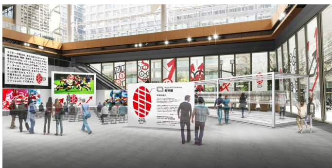
「ラグビーアート展」イメージパース

大会1年前を迎える9月13日（木）～20日（木）の期間には、ラグビーをテーマにした「美術館」、「ビジネススクール」、「映画館」を展開し、イベントを開催します。また、特設サイト「丸の内15丁目」をオープンし、バーチャルタウンとして本プロジェクトに関する情報発信を行っていくと同時に、プロジェクトに賛同していただき、街の住民として「丸の内15丁目」を一緒に盛り上げていただける方を募集し、さらなる機運の醸成を図っていく予定です。