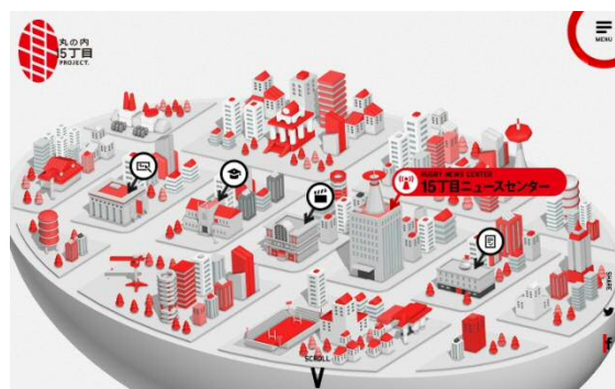
バーチャルタウン「丸の内15丁目」