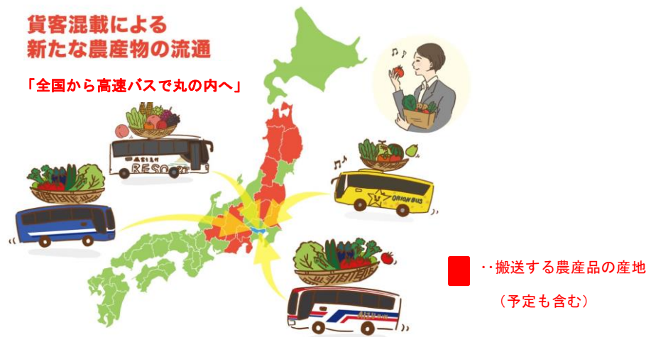
▲サービスのイメージ図

※2 丸の内エリアにおいて、首記4者の経営資源やネットワークを活用し、日本全国の生産者やJAと、丸の内エリア就業者や飲食店舗との連携を実現し、「食」「農」の分野で新たな価値創造に繋がる仕組みを構築するプロジェクト。2017年3月に4者連携協定を締結し、スタート。