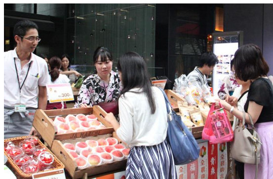
▲「大手町マルシェ×JA まるしえ」実施風景(2017年)