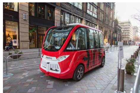
自動運転シャトルバス「NAVYA ARMA」

ソフトバンク株式会社及び当社は、SBドライブ株式会社協力のもと、より快適かつスムーズな交通インフラの実現に向けて、東京都千代田区の丸の内仲通りにて、SBドライブが所有する運転席がない自動運転シャトルバス『NAVYA ARMA（ナビヤ アルマ）』（仏Navya社製）の走行実験を実施。当時、東京23区内の公道を自動運転車両が初めて走行する試みとなった。