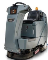
「RS26」(ソフトバンクロボティクス)

将来的な人手不足が懸念される清掃業務において、国内外の最新ロボットを積極的に導入し、ビルメンテナンスの将来像を丸の内エリアから発信するため、行幸地下通り及び新丸ビルオフィスエントランス・オフィスフロア共用廊下等で、複数の清掃ロボットの導入検証を実施予定。