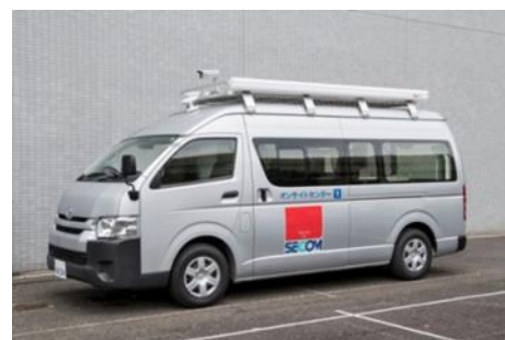
車両型の移動式モニタリング拠点「オンサイトセンター」

セコム株式会社と当社は、当社が主催する丸の内エリアのファッションイベント「MARUNOUCHI FASHION WEEK 2017」の11月24日（金）実施の一部催しにおいて、ウェアラブルカメラと、セコムが開発した新たな車両型の移動式モニタリング拠点「オンサイトセンター」を活用したセキュリティシステムの運用実験を、都市型イベントとしては初めて実施。