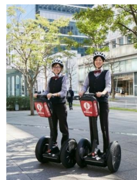
セグウェイに搭乗する街のコンシェルジュ

4月2日より悪天候を除く毎日、サービスは運用され、セグウェイに搭乗するコンシェルジュが、来街者に対するや道案内や安心安全な街づくりに向けた街の巡回等を実施中。