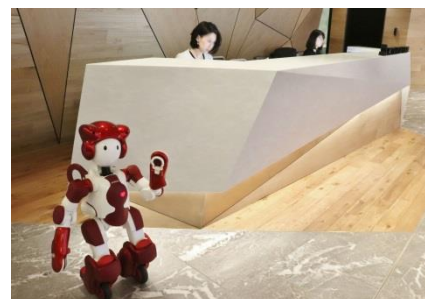
ヒューマノイドロボット「EMIEW3」

当社は、未来のオフィスの可能性や、将来の街への本格展開を見据え、株式会社日立製作所及び株式会社日立ビルシステムの協力の下、サービス支援ロボット「EMIEW3」の音声対話機能と自律移動機能を活用した受付案内の実証実験を当社新本社の大手町パークビル (2018年1月に大手町ビルより移転) にて実施。