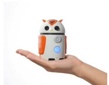
案内ロボット「ZUKKU (ズック)」

当社は、新丸ビル及び丸ビルにて、株式会社ハタプロが開発した案内ロボット「ZUKKU (ズック)」を用いた顔認証による店舗案内サービスの実証実験を実施。「ZUKKU」に搭載されたカメラを用いて顔認証を行い、性別・年齢を判別することで、人口知能(AI)によりその人に最適な店舗情報のご案内。また多言語対応機能を有しており、丸の内エリアに訪れる訪日外国人の方へのご案内も実施。