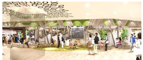
南館5階・レストスペース イメージ