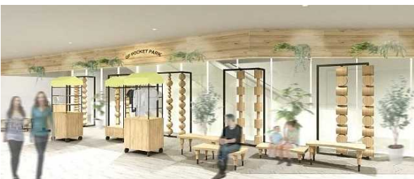
南館4階・レストスペース イメージ

南館4～6階にレストスペースを新設。POP UP SHOP やワークショップを実施できるスペースを併設し、ショッピングの合間にも楽しい時間を提供します。（10月5日オープン予定）