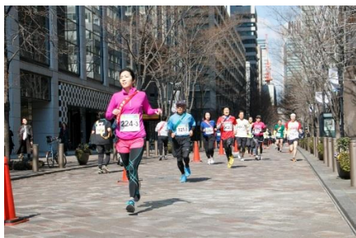
昨年開催時の様子

丸の内では、スポーツイベントの参加を通じてコミュニティを育み、就業者が主役となって盛り上がっていただくことで、街の活性化に繋げていくことを目指します。