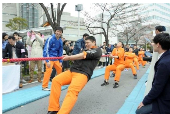
綱引き選手権の様子