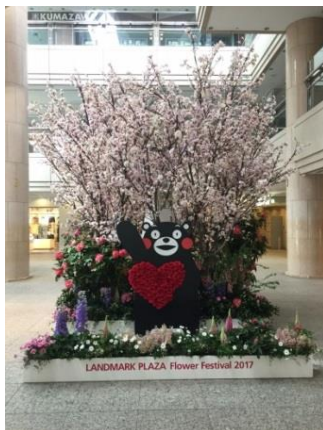
くまもんフラワーフォトスポット

三菱地所グループは、今後もみなとみらい 21 地区ひいては横浜全体をより魅力的な街にするため、賑わいづくりに寄与する取り組みを行ってまいります。