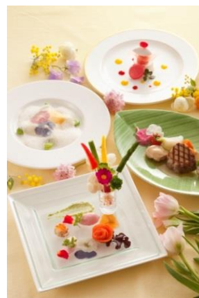
カフェフローラ スペシャルランチ