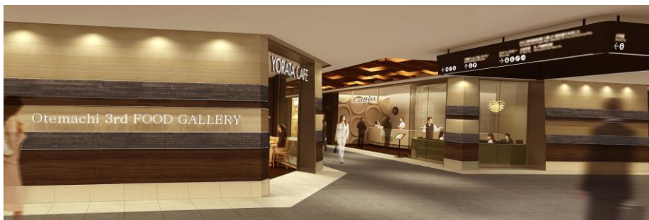
地下1階貫通路（イメージ）