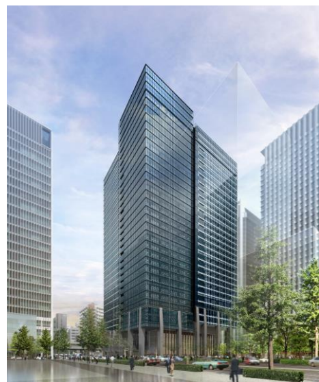
大手町フィナンシャルシティ グランキューブ