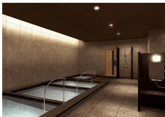
SPA OTEMACHI FITNESS CLUB 内大浴場（イメージ）