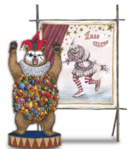
国際ビル 1階エントランス イメージ

サーカス団を率いる頼もしいリーダーは、クマなのです。優しく、いつもみんなを楽しませてくれる、そんな団長みずからお出迎え。さあ、みんなクリスマスサーカスを楽しんで。