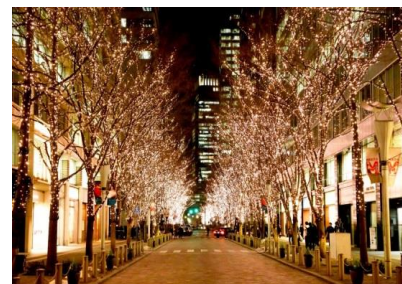
丸の内イルミネーション過去開催時の様子