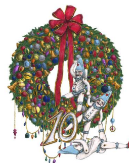
東京ビル TOKIA 1階エントランスホール イメージ

クリスマスサーカスの目玉の一つ、それは、エルフたちの空中ブランコ。周年を祝うリースにぶらさがって遊んでいるようですね。エルフたちと一緒に記念すべき節目をお祝いしましょう!