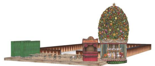
丸ビル1階マルキューブ イメージ

今年のスペシャルメンバーはなんとスケート界のスーパースター羽生結弦くん！！羽生くんと団員たちが作った特別なスケートリンクのそばには世界に一つしかないクリスマスツリーや羽生くんのオブジェも。