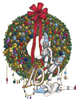
東京ビルTOKIA1階 リースイメージ