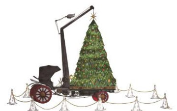
新丸ビル 3階アトリウム イメージ