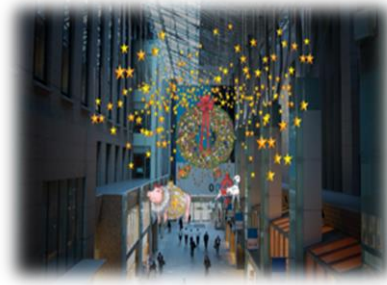
丸の内オアゾ 1階貫通通路 イメージ

サンタの国のクリスマスリースはとっても大きいので、いつも飾るところを探すのが大変なのです。でも今年は、ぴったりの場所を見つけました。団員達も喜んで空中散歩を始めたようです。