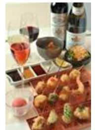
串あげもの 旬 s