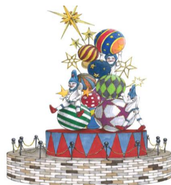
丸の内ブリックスクエア 一号館広場 イメージ

やんちゃなエルフ達が大好きなのが玉乗り。どうやら、大小様々な玉を積み上げて、クリスマスツリーを作ったみたいです。可愛いツリーができて、エルフ達も大満足。あまりにも気に入って、離れようとしません。