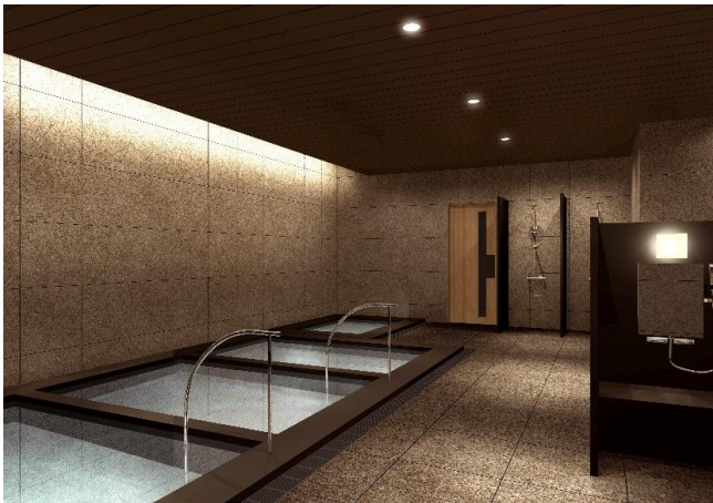
大浴場 イメージパース