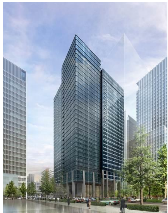
グランキューブ 外観パース