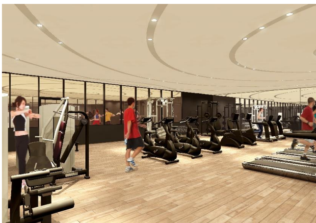
トレーニングルーム イメージパース